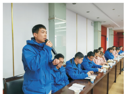
青年员工主动学习、努力工作。

新员工，坚持正确价值观，求真务实，脚踏实地，从基层做起，从点滴做起，不好高骛远，在追求事业成功的路上永葆激情，不断成长、进步，用自己的专业特长，为公司发展注入新的动力；公司也会为员工创造舒适的工作环境，丰富的群团活动，来提升大家的融入感和归属感。此外，石总还详细阐述了集团公司双晋升通道、证书补贴、收入待遇与福利等利好政策，激励青年员工主动学习、努力工作。