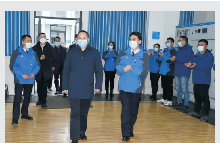
1月29日，荆州市委书记吴锦一行莅临荆州水务集团慰问供水一线干部员工，并送上了新春的问候和祝福。

荆州市内部资料准印证第 36 号 2022年2月28日 星期一 总第217期 地址：荆州市南湖路9号 电话：0716-4309982 E-mail:jsjtqdb@163.com