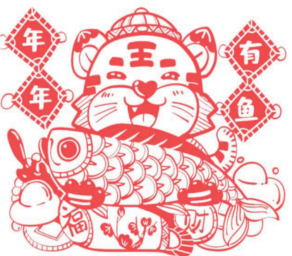
员工剪纸 《年年有余》